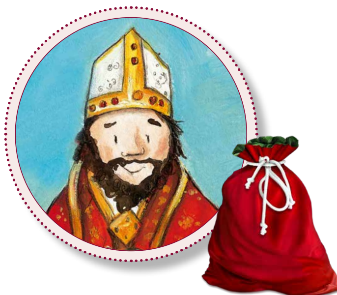
Illustration: Petra Lefin