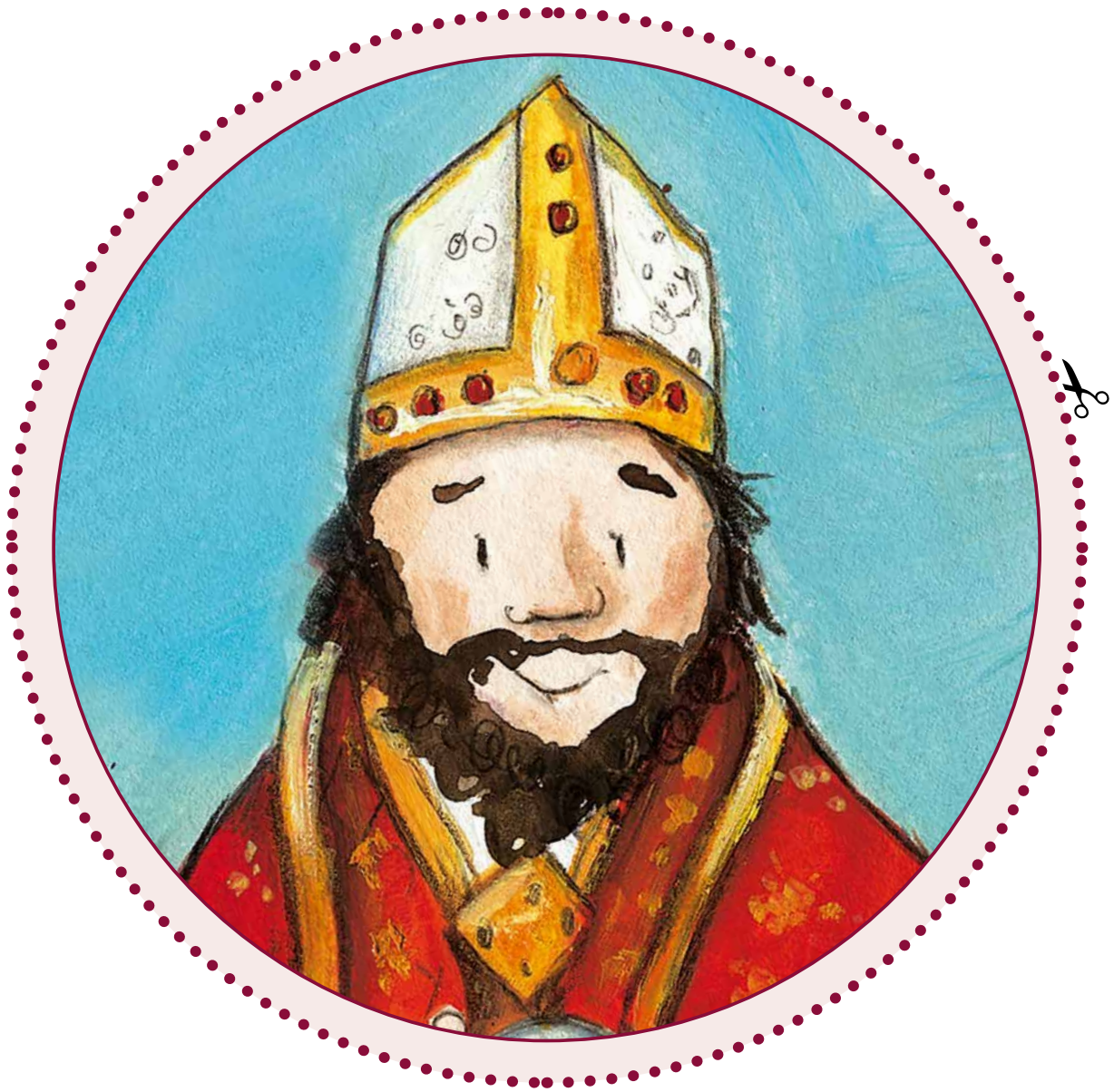
Illustration: Petra Lefin